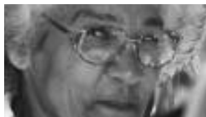
Archives des Petits frères des pauvres